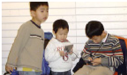
嘩，Game Boy 好刺激！