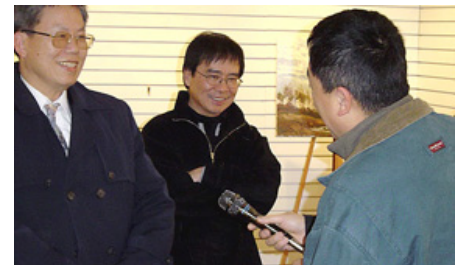
來者何人報上名來