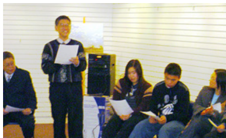
音樂一停你要小心