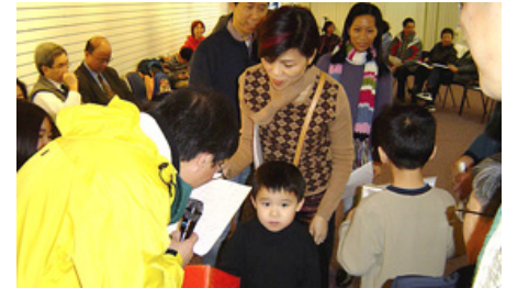
你想要份大定細的呢？